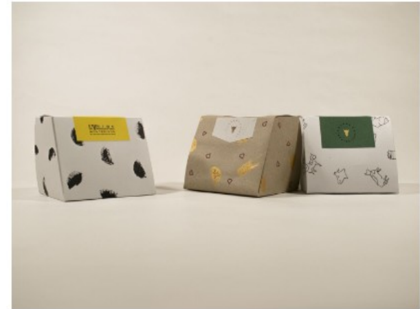
Atelier Design & Packaging