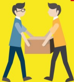
Lien social, solidarité