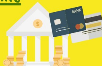
Banques, monnaie, financement

Les SES : un enseignement de spécialité pluridisciplinaire